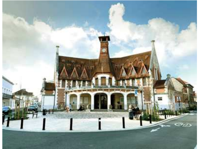
Maison cantonale (1924-1926).