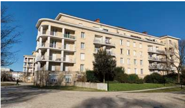
Cité Pinçon (1948-1955)

Elle est inscrite au titre des monuments historiques en 1994.