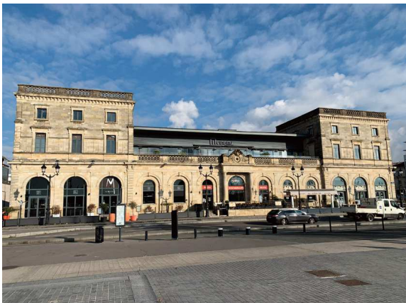
Gare d'Orléans (Anciennement gare de Bastide-Orléans)

La construction du pont de pierre (1822) et la percée de cette grande avenue (1830) du palus des Queyries au pied des côteaux, dans l'axe de la porte de Bourgogne, vont permettre le développement de l'activité portuaire et industrielle, ainsi que l'urbanisation du quartier.