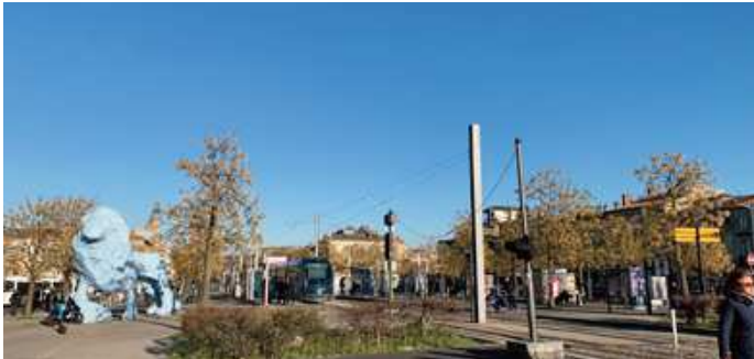
Place Stalingrad et avenue Thiers. (Anciennes Place du Pont et avenue de Paris)

La construction du pont de pierre (1822) et la percée de cette grande avenue (1830) du palus des Queyries au pied des côteaux, dans l'axe de la porte de Bourgogne, vont permettre le développement de l'activité portuaire et industrielle, ainsi que l'urbanisation du quartier.