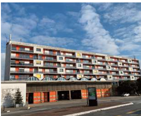
Caserne des pompiers de La Benaige

La caserne a été construite entre 1950 et 1954 sur le terrain de l'ancienne gare de Bordeaux-État fermée en 1939 et détruite en 1950. En 2008, l'édifice a été labellisé « Patrimoine du XX e siècle ». Elle est désormais inscrite au titre des monuments historiques par arrêté du 22 septembre 2014. Une nouvelle caserne devrait voir le jour dans le quartier d'Euratlantique en 2022. Auparavant il existait plusieurs casernes dans le quartier comme celle de la rue de Châteauneuf. (photo de droite)