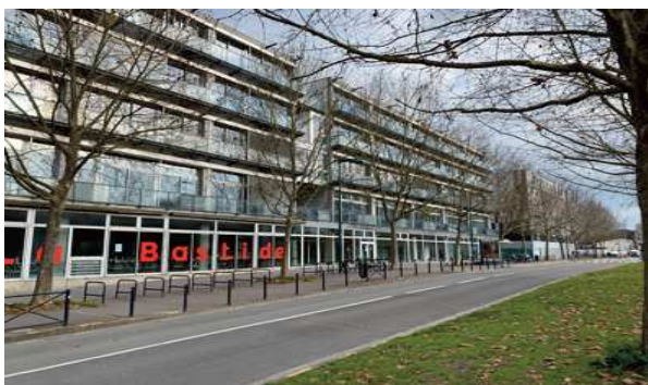
IUT Bordeaux Montesquieu (2011)

Pôle universitaire des Sciences de gestion.