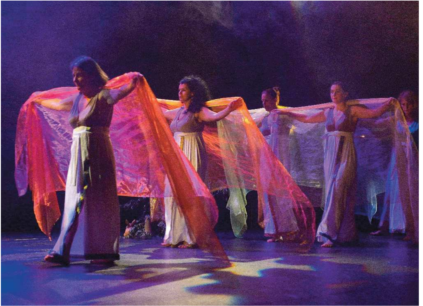
Conte de fées