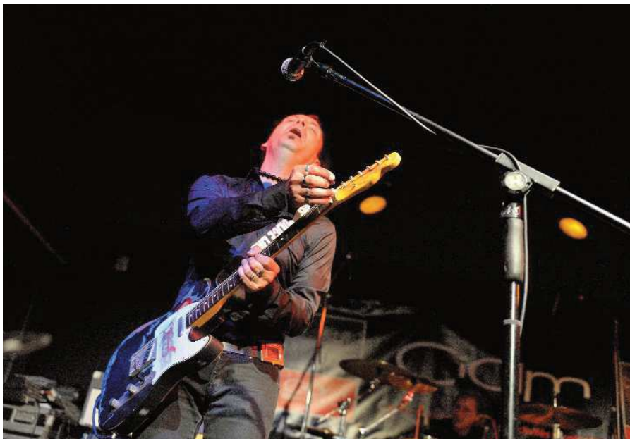
Guitariste bien énérvé